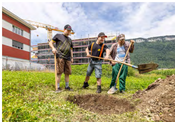
Klienten proben das Baumpflanzen

Für die gute Zusammenarbeit mit den Verantwortlichen bei Kanton und Gemeinden, mit den Mitgliedern des Stiftungsrates sowie mit unseren Kunden und Partnerorganisationen möchte ich mich ganz herzlich bedanken. Ebenso gilt ein grosser Dank der Geschäftsleitung, allen Angestellten sowie Klientinnen und Klienten für das schöne Miteinander im Weidli.