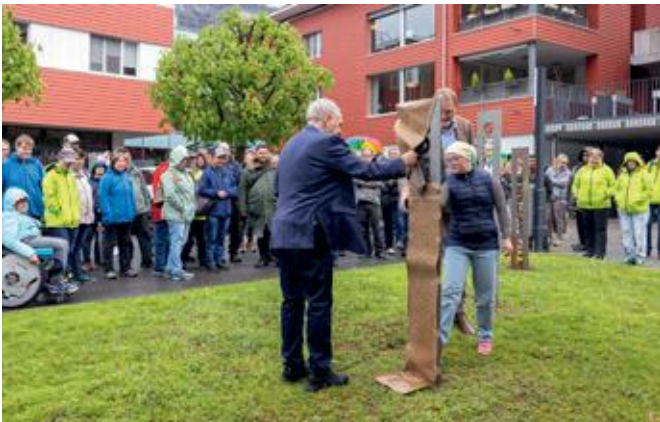
Enthüllung des Werts "wirtschaftlich"