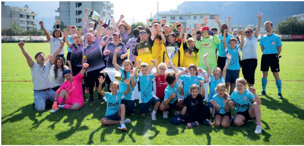
HergisWeidli-Match - Alle waren Sieger