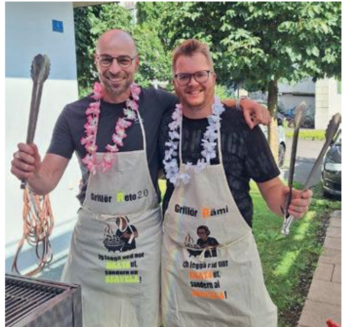
Sie legen nicht nur Musik auf, sondern auch Savelas