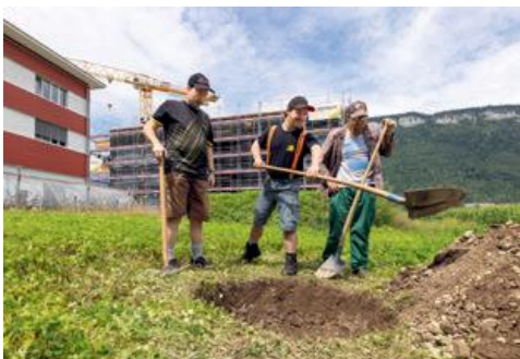
Klienten proben das Baum•pflanzen

Ich bedanke mich beim Kanton und den Gemeinden. Bei den Mitgliedern des Stiftungsrates. Bei unseren Kunden und Geschäfts•partnern. Auch der Geschäftsleitung, allen Angestellten, Klientinnen und Klienten für das schöne Miteinander im Weidli.