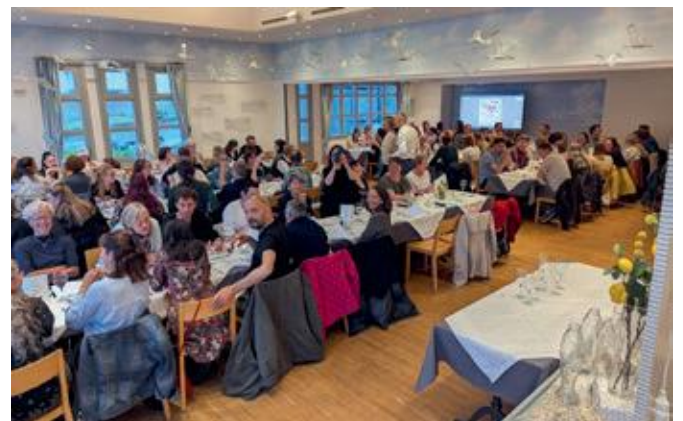
Gemütlicher Personalabend im Glasi-Restaurant