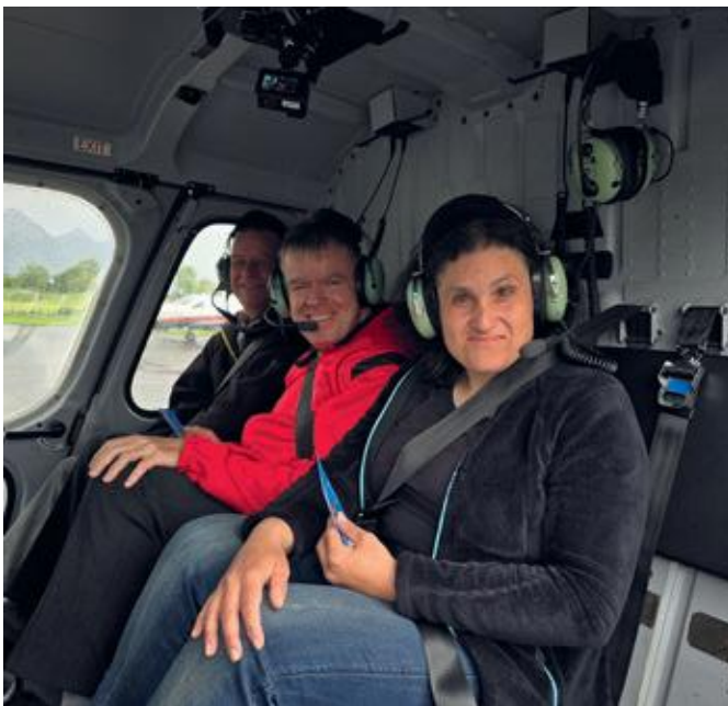
Besuch bei Alpinlift