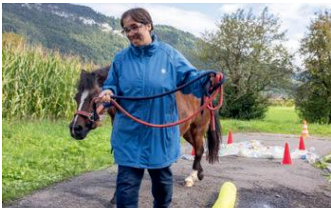
Mit tierischer Begleitung