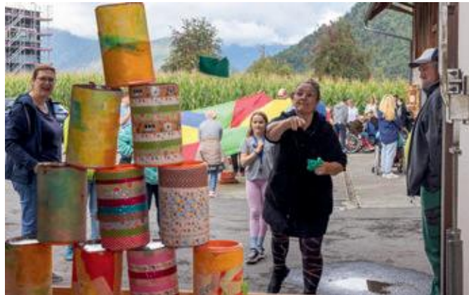
Fit-durä-Tag mit Spiel und Spass