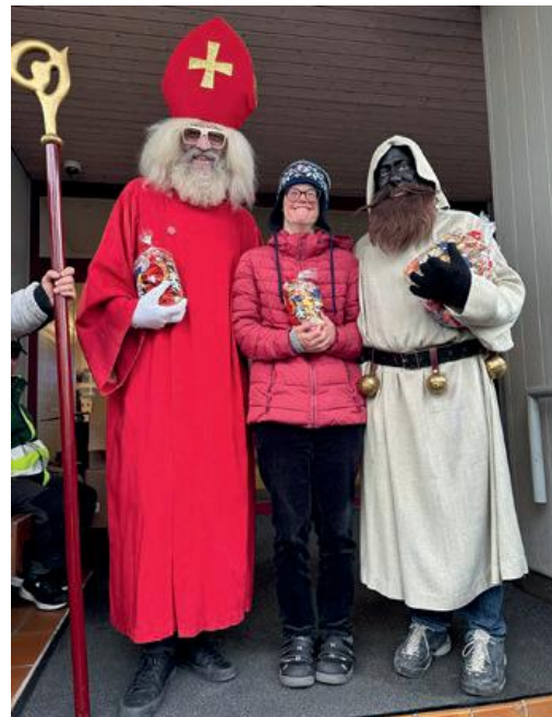
Besuch vom Samichlaus und Schmutzli