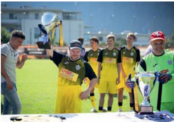
Verteilung des Preises am HergisWeidli-Match

Die Fachstelle sexuelle Gesundheit wurde im Januar 2026 gegründet. Da können sich die Klientinnen, Klienten und das Personal von einer Fachperson beraten lassen. Wir wollen, dass die Leute sich mehr für das Thema interessieren. Dafür gibt es auch Schulungen.