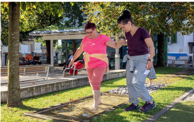
Jährliche Sensibilisierung Fit durä Tag

Die nächsten 4 Werte der Mitmach•projekte werden wir den Menschen im Weidli näher bringen.