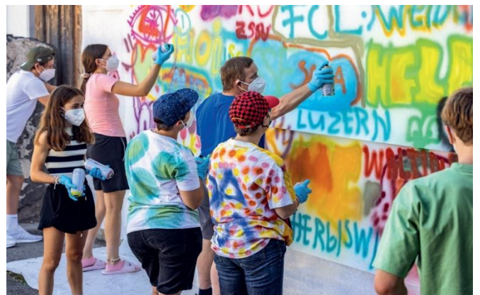
Sprayen im Kultur•projekt Zusammen Wachsen